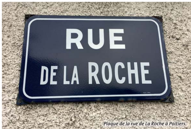
Plaque de la rue de La Roche à Poitiers.