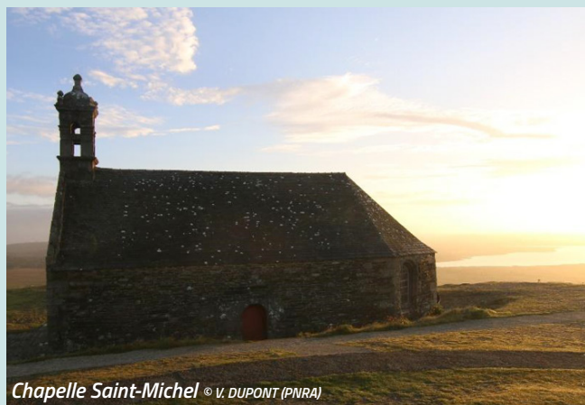
Chapelle Saint-Michel