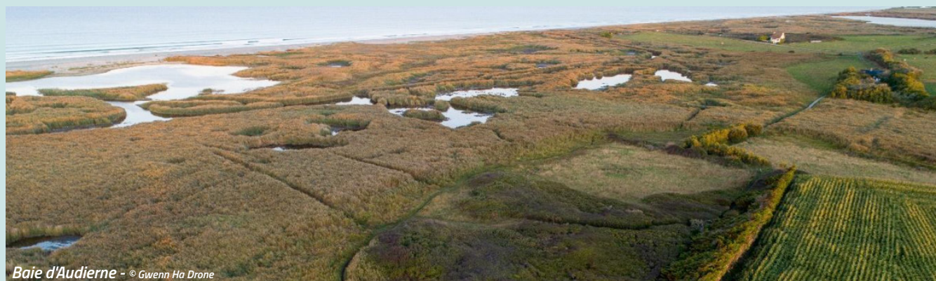
Baie d'Audierne