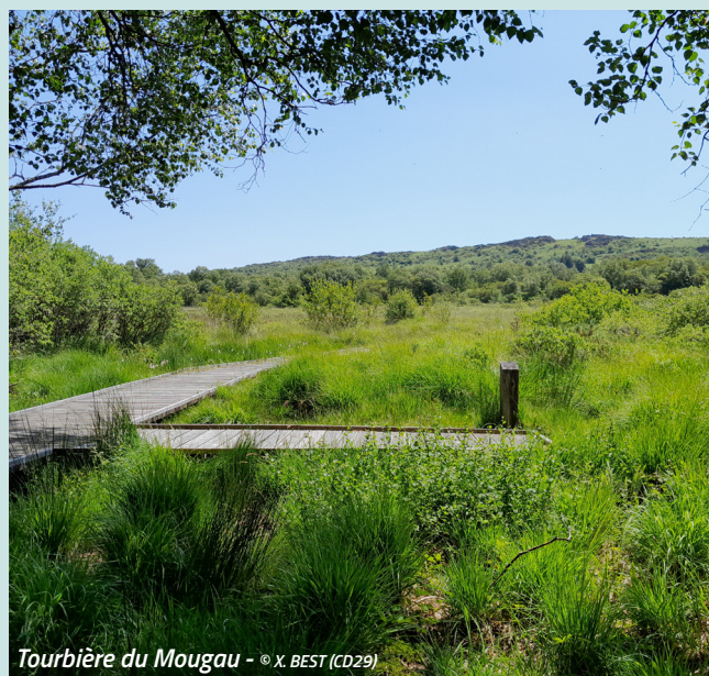
Tourbière du Mougau